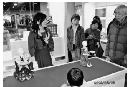
からくり人形：茶運び人形のデモンストレーション