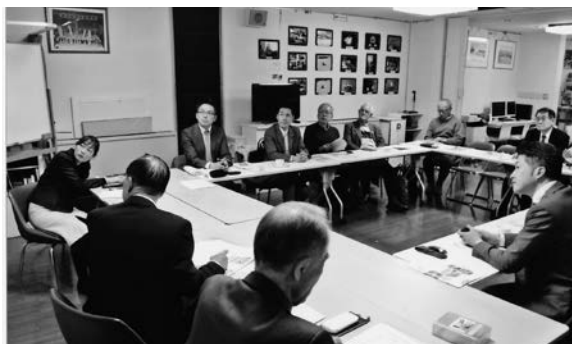
講演会を受講する皆さん