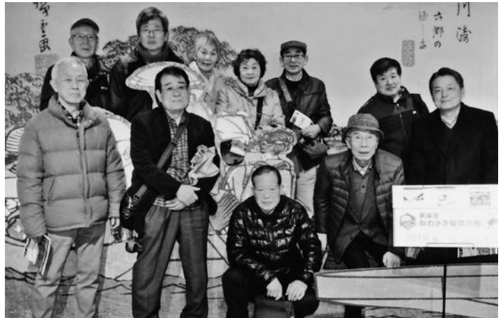
かわさき宿交流館にて

川崎駅は小生が都内に行き来する途中での駅であり、この施設は駅からも近い場所であり今後も時々覗いて観る気になった。